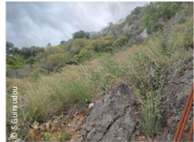
Œuf, chenille et habitat de l'Hespérie du barbon observé en 2025