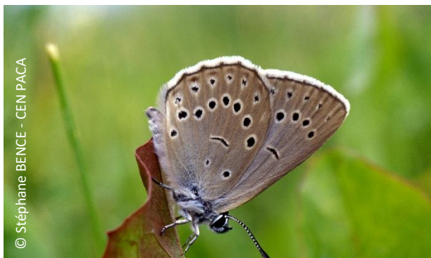
L' Azuré de la sanguisorbe Phengaris telejus (à gauche), menacé par le drainage des zones humides dans les Préalpes du Sud, et le Faux-cuivré smaragdin Tomares ballus (à droite), menacé par l'urbanisation dans les départements méditerranéens : deux espèces classées dans la catégorie « En danger » dans la Liste rouge régionale de Provence-Alpes-Côte d'Azur 2024

Le document PDF fourni à l'UICN et le tableur avec la Liste rouge sont disponibles sur le site internet du Conservatoire : cen-paca.org