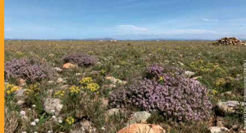
Paysage de Crau.