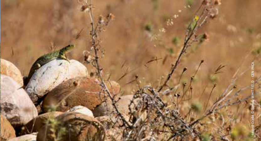
Lézard Ocellé