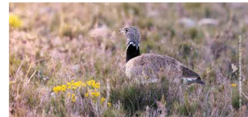
Ouzarde canepetière

Papillons et petites bêtes Contribuez à la connaissance du site en participant à cet inventaire organisé par le conservateur de la Réserve. Pour 2h, 4h ou 6h selon votre motivation. Experts ou amateurs, vous êtes les bienvenus ! à partir de 8h / dès 10 ans / gratuit