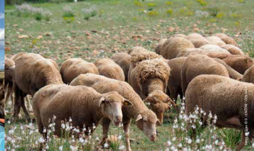
Sortie @ Crau