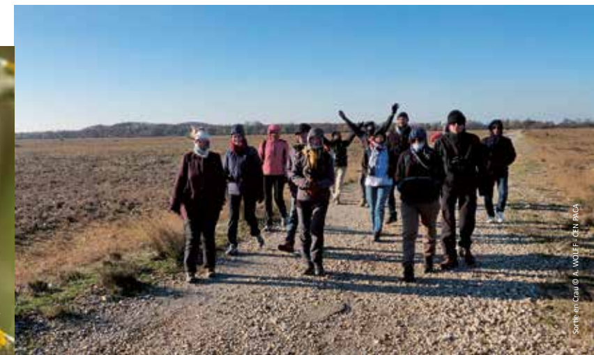
Sortie en Crau

VISITES GUIDÉES, SORTIES & ATELIERS POUR TOUS