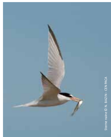
Sterne naïne