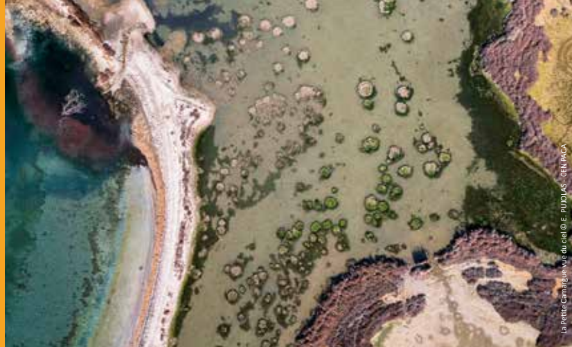
La Petite Camargue vue du ciel