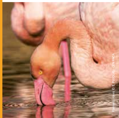
Filmé aux roses

Un sentier de 4,5 km vous permettra de découvrir le site. Merci de respecter les lieux !