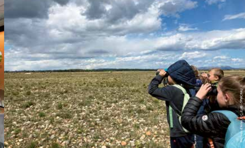
Mérimos d'Arles