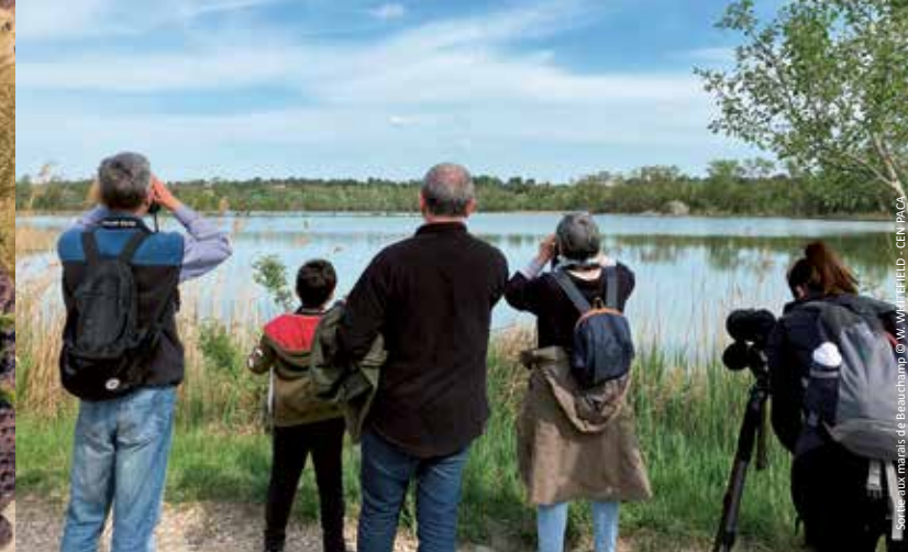
Sortie aux marais de Beauchamp