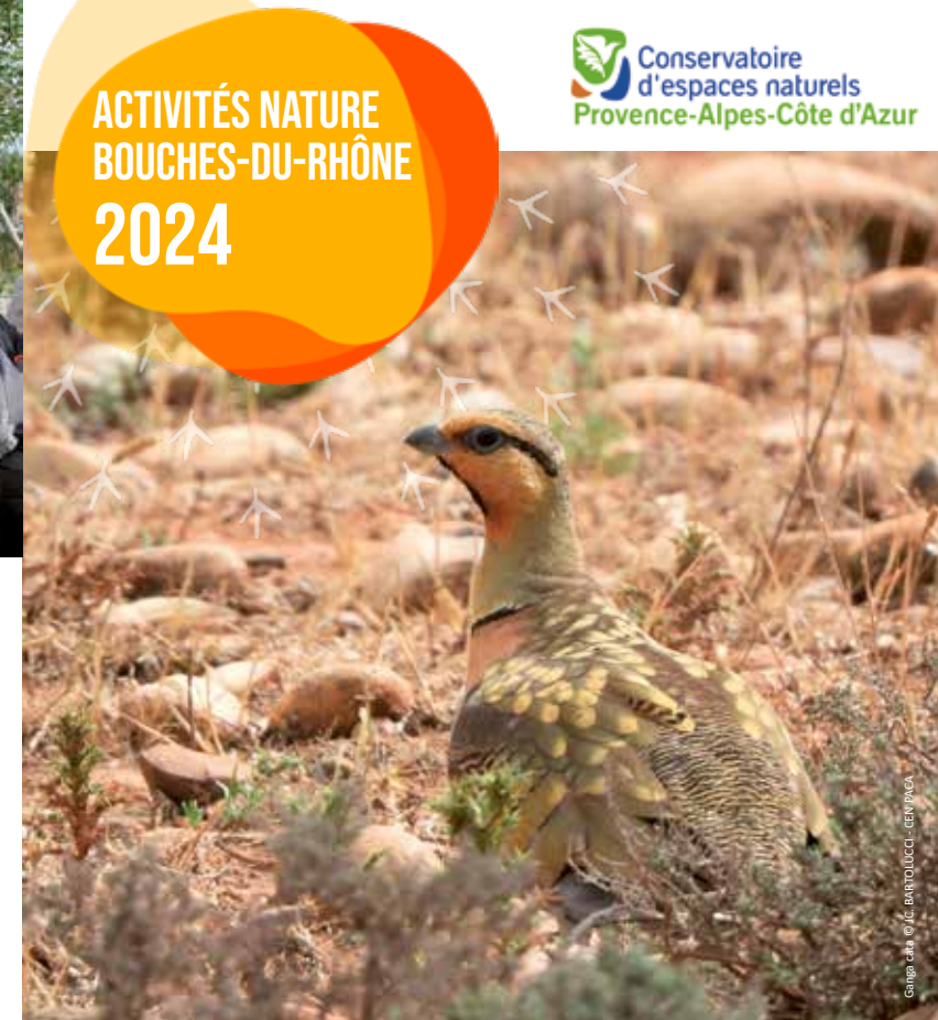
Ganga cata

Parking derrière le stade de Pont de Crau.