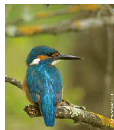
Martin pêcheur