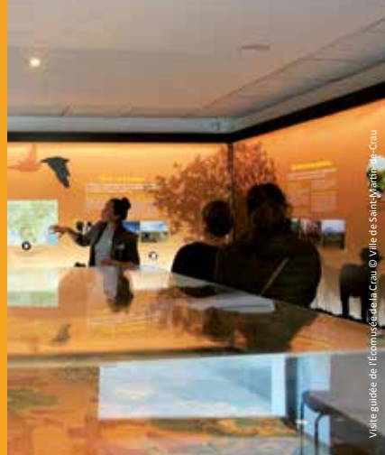
Visite guidée de l'Écomusée de la Crau