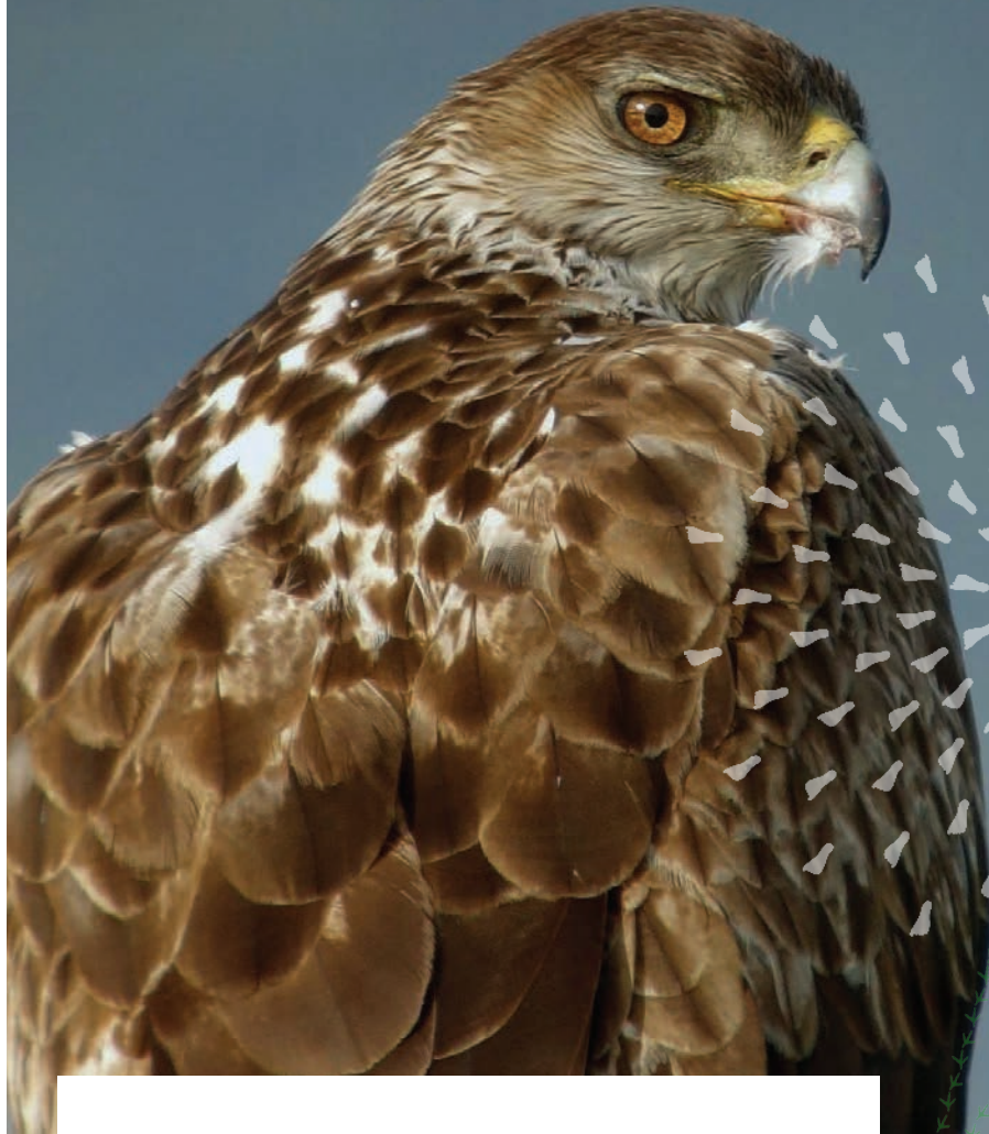
L'Aigle de Bonelli