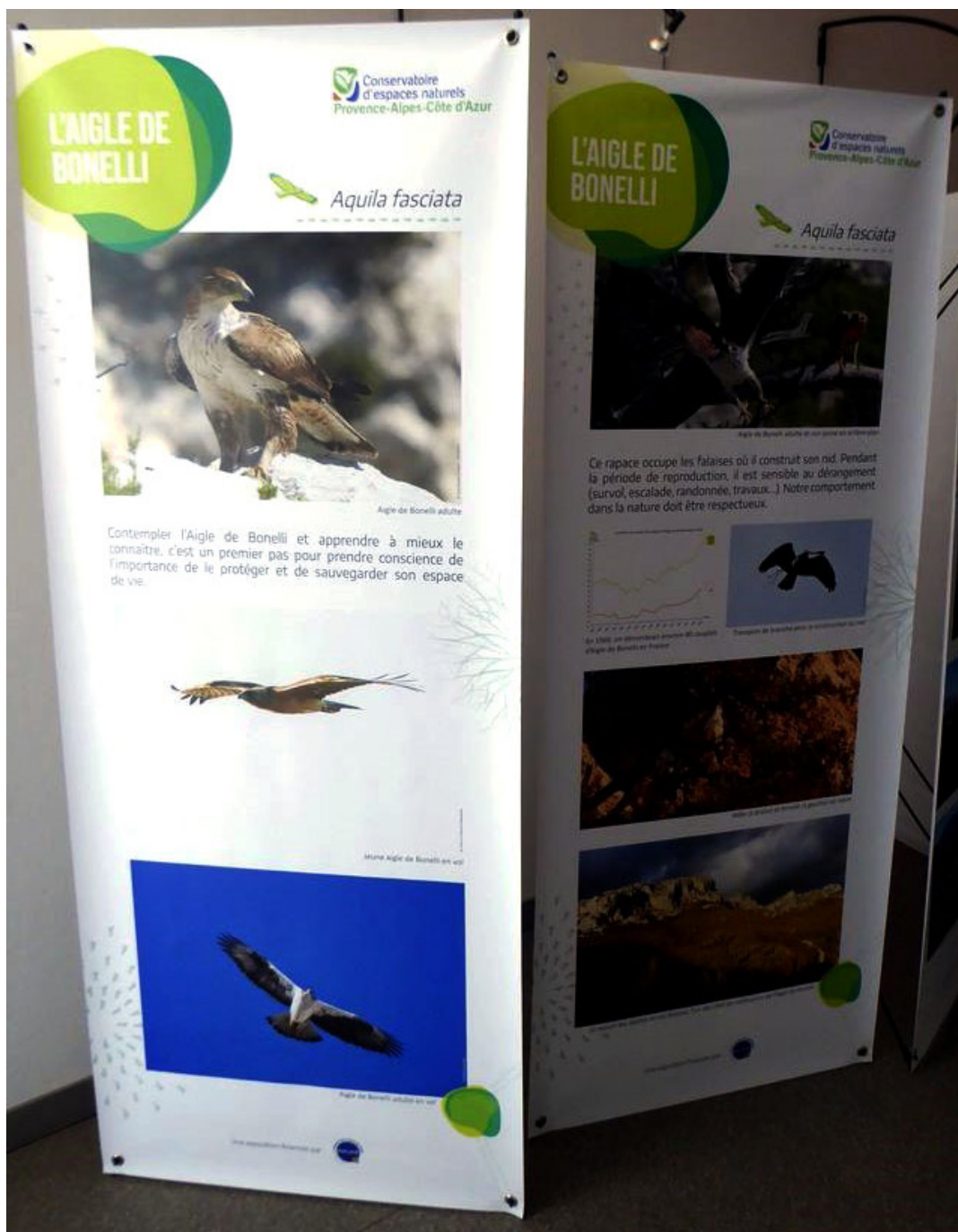
Exposition itinérante « L'Aigle de Bonelli »

Dans le cadre de l'animation du Plan national d'Actions en faveur de l'Aigle de Bonelli, le Conservatoire d'espaces naturels de Provence-Alpes-Côte d'Azur (CEN PACA) souhaite sensibiliser le public sur cette espèce emblématique. Ainsi, le Conservatoire propose, avec le soutien de la Fondation Barjane, une exposition itinérante intitulée « L'Aigle de Bonelli ».