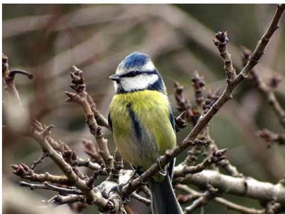
Mésange bleue © Frédéric Portalier