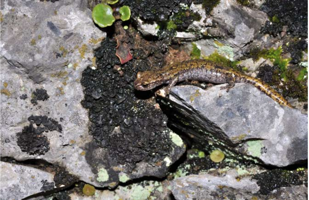
Figure 1 : Spéléomante de Strinati adulte au sein d'un muret en pierre de soutènement en situation épigée, Breil-sur-Roya, Alpes-Maritimes.

Figure 1: Adult of French cave salamander within a retaining wall (epigeic habitat), Breil sur Roya, Alpes-Maritimes.