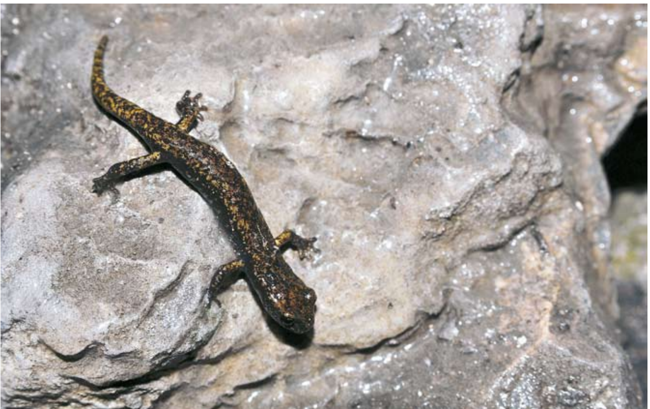
Figure 2 : Spéléomante de Strinati adulte dans une cavité en situation hypogée, Saorge, Alpes-Maritimes.

Figure 1: Adult of French cave salamander within a retaining wall (epigeic habitat), Breil sur Roya, Alpes-Maritimes.