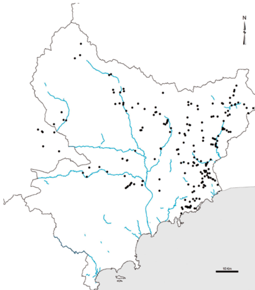
Figure 3 : Répartition des localités (cercles noirs) de Spéléomante de Strinati dans les Alpes-de-Haute-Provence, les Alpes-Maritimes et la principauté de Monaco.

Dans les Alpes-de-Haute-Provence, le Spéléomante de Strinati n'a été observé qu'à l'est du département à la limite avec les Alpes-Maritimes au sein de quatre communes (Saint-Benoît, Entrevaux, Sausses et Castellet-lès-Sausses).